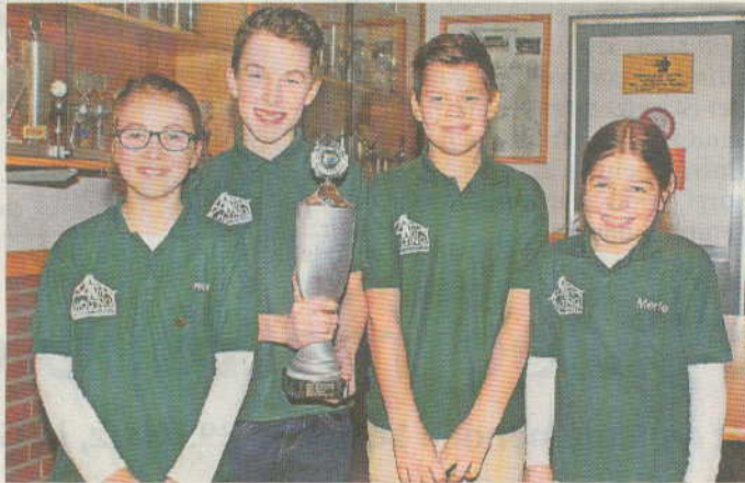
Der Wanderpokal für Schülermannschaften ging in diesem Jahr nach Burweg.